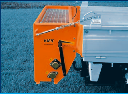
Anbaustreuer TM 100/120