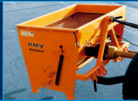
Anbaustreuer TM 200/300

Für Kleintraktoren, Geräteträger und Spezialgerätr äger zur Sand-, Salz- und Gemischstreuung.