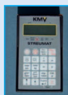
Zubehör: Fernbedienung KMV-Streumat für wegeabhängige Streuung

Mit dem Kombi 1 ist effizientes Streuen auf einer Streubreite von 1–6 m möglich. Sowohl die Dosierung der Streumenge als auch der Streubild sind hydraulisch regelbar; das Streubild ist mechanisch verstellbar.